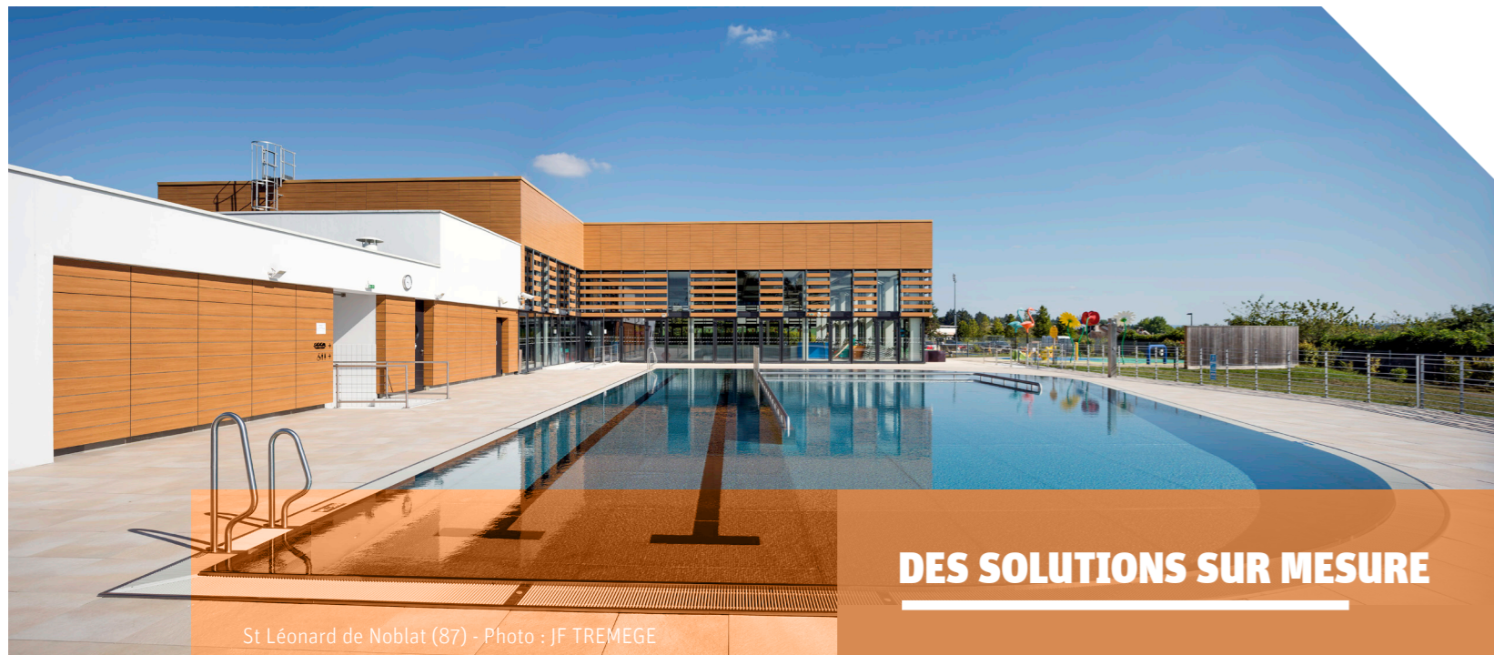
St Léonard de Noblat (87) - Photo : JF TREMEGE