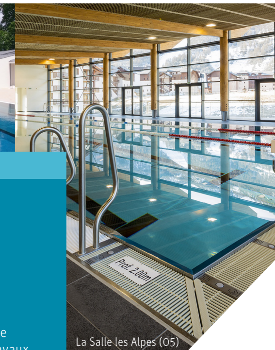
La Salle les Alpes (05)

Structure des parois constituée d'inox soudé. Le fond de bassin est assuré par une membrane PVC armée posée sur le radier en béton constitutif du fond de bassin, pour travaux de bassin neufs et/ou en réhabilitation en conception d'habillage ou structurelle ou auto-portante.