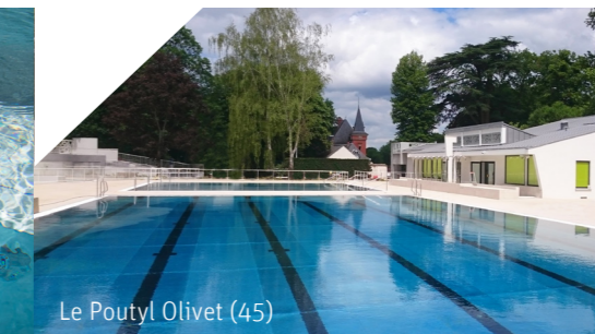
Le Poutyl Olivet (45)