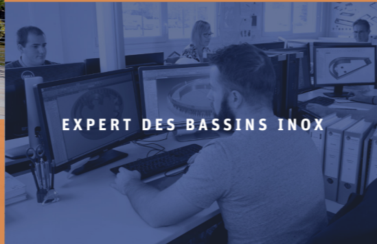
EXPERT DES BASSINS INOX